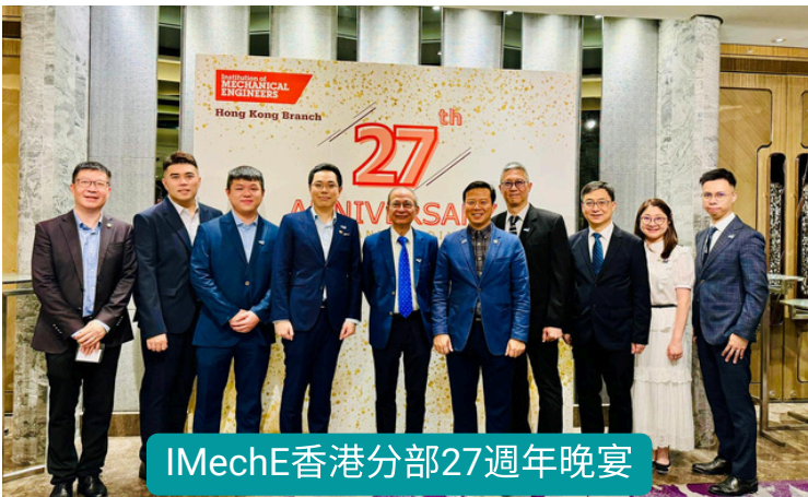
IMechE香港分部27週年晚宴