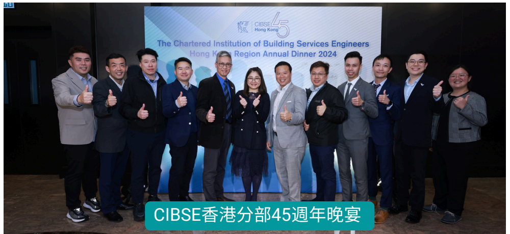
CIBSE香港分部45週年晚宴