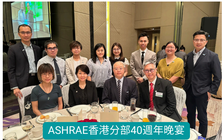
ASHRAE香港分部40週年晚宴